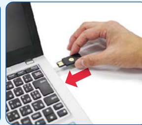
USBセキュリティ鍵をUSBポートに挿入