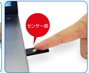
USBセキュリティ鍵の中央センサー部分にタッチ