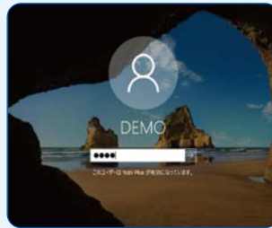
Windowsログインパスワードを入力

担当の方とやりとりを重ねていく中で、『Yubi Plus』はセキュリティレベルを上げ、可能な限り教職員に負担を掛けず、かつ管理者が簡単な方法で運用ができる製品だとわかりました。導入も、短期間で完了できる点も魅力的でした。USBセキュリティ鍵も小さく、耐久性もあり、職員からも『分かりやすい』と評判は上々です。