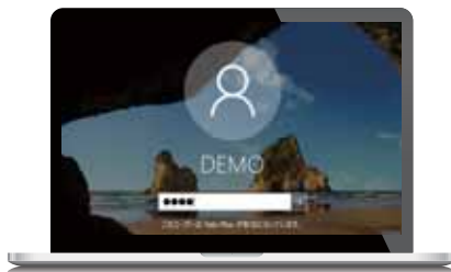
従来のID・パスワード