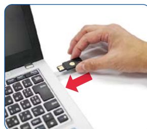
USBセキュリティ鍵をUSBポートに挿入