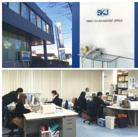
SKJ様を訪問し、お話を聞きました