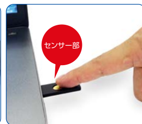
USBセキュリティ鍵の中央センサー部分にタッチ