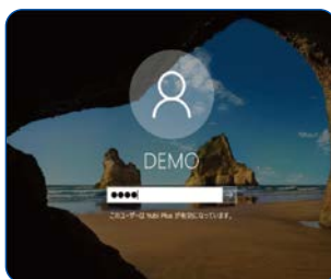
Windowsログインパスワードを入力