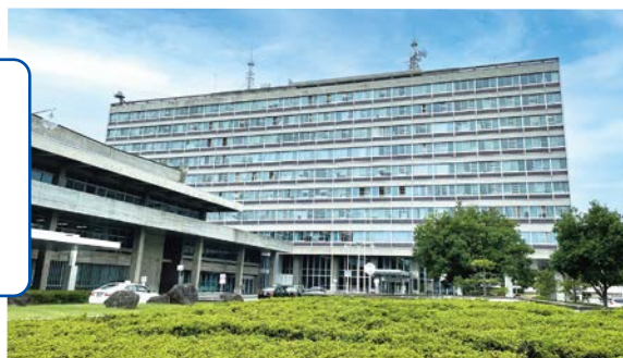
長野県教育委員会 (長野県庁)