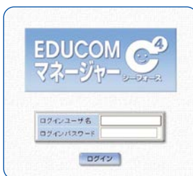
校務支援システムのログインパスワードを入力