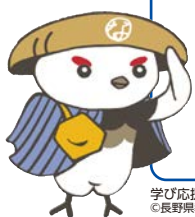
学び応援キャラクター「信州なび助」 ©長野県教育委員会信州なび助