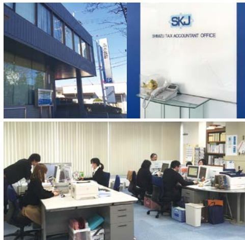
SKJ様を訪問し、お話を聞きました