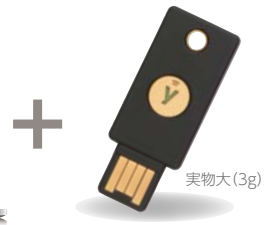
USBセキュリティ鍵から 発行される ワンタイムパスワード 実物大(3g)