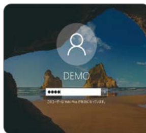
Windowsログイン パスワードを入力