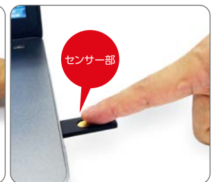
USBセキュリティ鍵の 中央センサー部分にタッチ