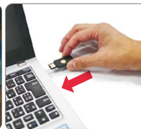
USBセキュリティ鍵を USBポートに挿入