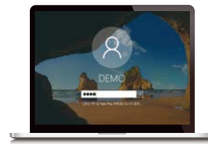
Windows ログインパスワード